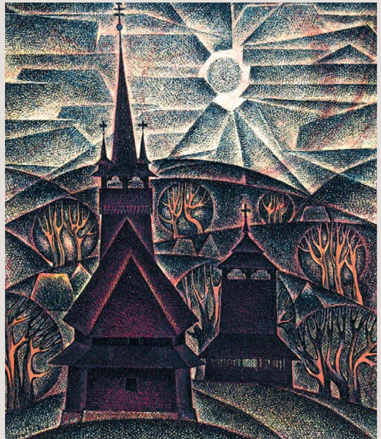
Олександрівка. Церква св. Параскеви, 1753 р. Храм у стилі провінційної готики увінчує розлогий пагорб в центрі села. Не оточена деревами, споруда домінує в ландшафті, що зазнав незначних цивілізаційних змін. Відкритий простір набуває симфонічного звучання, об'єднується навколо вертикальних форм