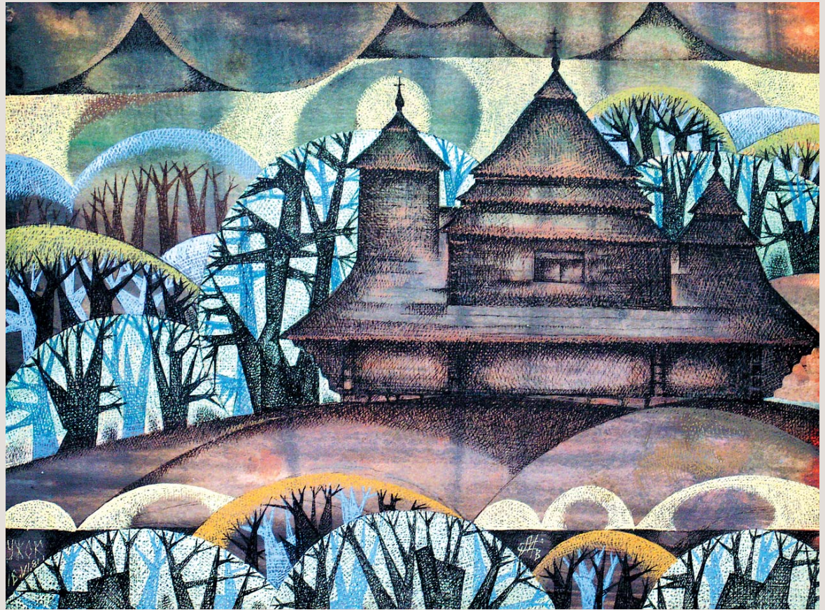
Ужок. Церква св. Михайла, 1745 р. Одна з найдосконаліших триверхих церков бойківського стилю, занесена 2013 року в список світової спадщини ЮНЕСКО. Децю казковий антураж підсилює враження від давньої споруди і неперушеного впродовж століть розташування храму