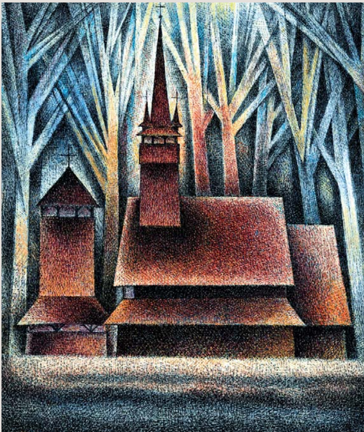
Сокириця. Церква св. Миколи, 1704 р. Церква, можливо, найбільш монументальна, «героїчна» з готичної четвірки Хустщини. Враження підсилює суворя простота великих площин дахів, закритий ганок, таємнича мовчазність споруди на зеленому островці серед молодших за церкву дубів