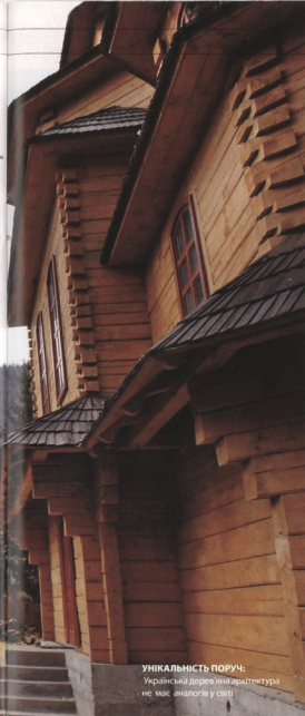
Унікальність поруч: Українська дерев'яна архітектура не має аналогів у світі

На думку дослідниць-аматорки, у дерев'яних храмах чітко виражені національні риси архітектури: «Вони шитомо українські й автентичні. Львівське жозацькі церкви, ступінчасті бойківські храми, закарпатська дерев'яна готика не мають аналогів у світі», – підкреслює вона.