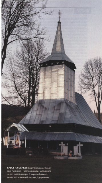
Хрест на церкві: Дмитрівська церква у селі Рипиніне – зразок шкоди, заподіяної через добрі наміри. Її відкрили білшоку, яка псує і зовнішній вигляд, і деревину

Сідли дерев'яної архітектури професор шукає з 1980-х років. Зауважує, що всі об'єкти не схожі один на одного та пропорційно відмінні: це тому, що кожен будівничий має свій мірний, тобто емпіричний паличку завдовжки 5 паль-