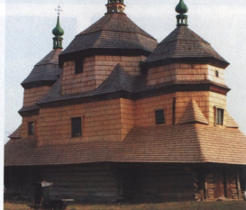
СВІДОМА ГРОМАДА: Церкву в Комарному відреставрували за всіма правилами